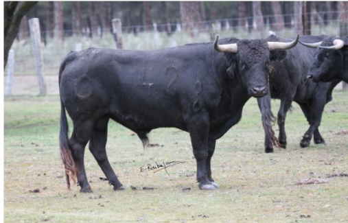
Toros en Vic : novillada de samedi 10 juillet

Le Club Taurin vicois présentera lors de Toros en Vic de juillet un lot exceptionnel de toros "à la vicoise" qu'affrontera un très beau cartel.