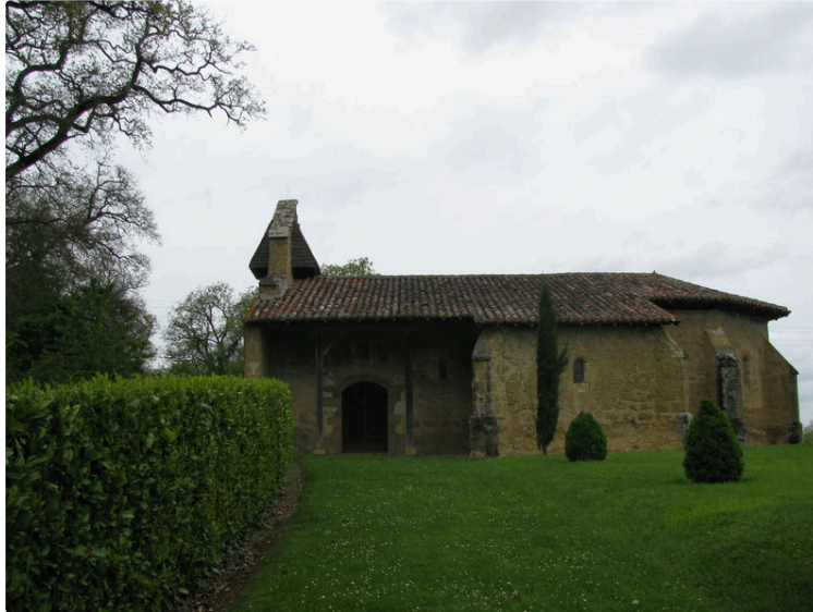
Aucune augmentation du taux d'impôts fonciers depuis six ans

La dernière réunion du conseil municipal était consacrée au budget