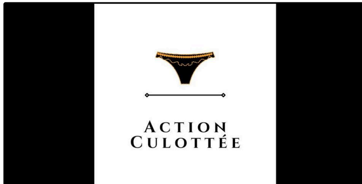
Une collection dont il n'a certainement jamais eu la moindre envie

À l'Hôtel Matignon, la boîte aux lettres du Premier ministre Jean Castex encombrée de petites culottes