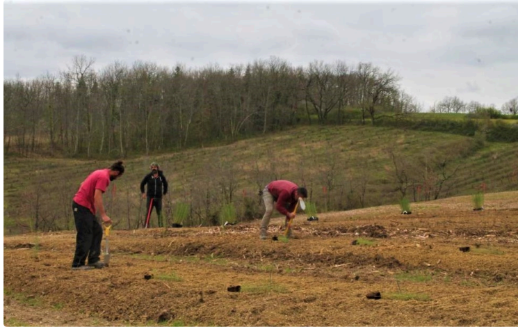
“Esperense”, quels arbres pour demain ?

C'est un projet national qui porte le nom de “Réseau Esperense”, doux acronyme de RESeau national multiPartenaire d'Evaluation de Ressources gENétiques foreStièrEs pour le futur, et tout l'espoir d'un patrimoine forestier à réinventer pour mieux le préserver.