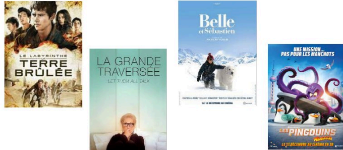
"Belle et Sébastien" entre autres propositions pour votre soirée télé de mardi

A vous proposer mardi soir, de la science-fiction, une comédie dramatique ou deux films pour petits et grands.