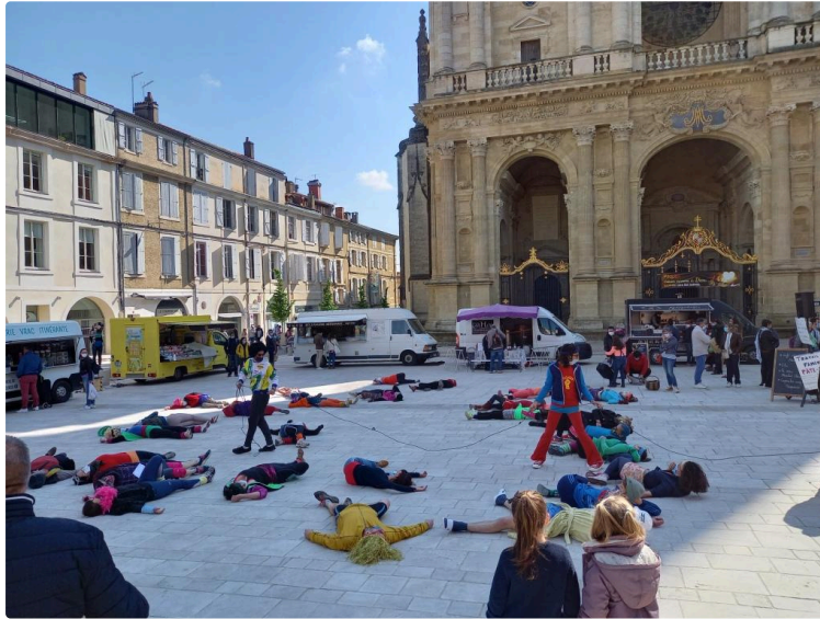
Lors de sa balade, le piéton trébuche sur deux "manifs"