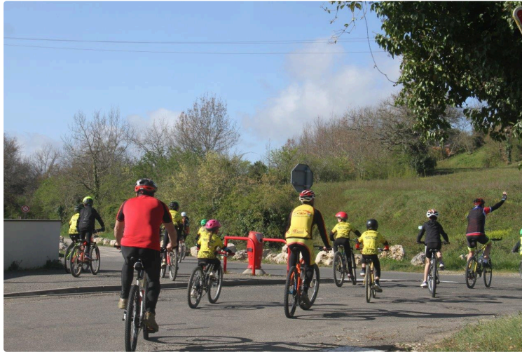
La mobilité active : participez à son développement sur le Pays d'Armagnac !

Favoriser les pratiques cyclables pour certaines mobilités du quotidien : aller au travail, faire ses courses, se divertir..., en complément des pratiques sportives ou touristiques existantes sur le territoire.