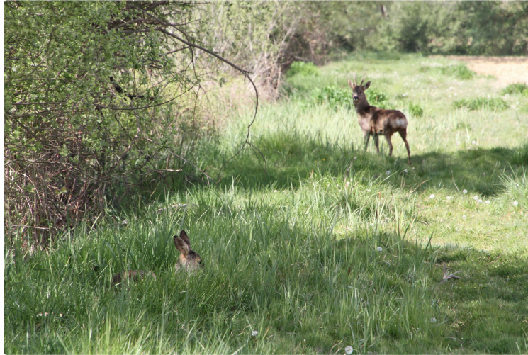
Un week-end qui ne s'annonce pas trop désagréable ?

Au calme et pas forcément très loin de chez vous, vous pourrez profiter de la nature environnante en restant dans votre zone à respecter.