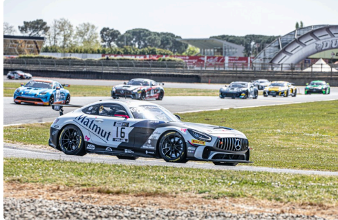
Course2 Mercedes Akka n°16 Drouet Barthez