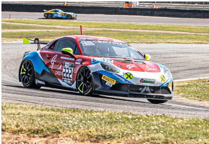
L'Alpine n°222 de Wallgren/Castelli dans la Course 1

C'est clair : les pilotes voulaient en découdre et ils l'ont montré. Les deux courses de cette épreuve reine des Coupes de Pâques - chaque course dure 1 heure avec changement de pilote - ont été pleines de rebondissements. Surtout la course 2 qui a eu lieu lundi de Pâques 5 avril. Mais déjà, les essais qualificatifs avaient été très serrés.