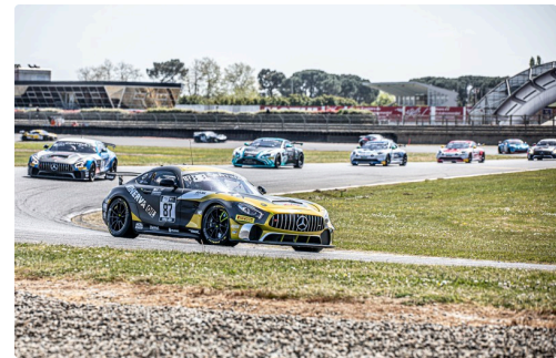
Course 2 Mercedes Akka n°87 Beaubelique/Pla