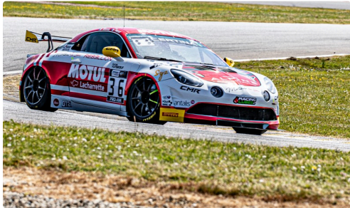
Course 2 Alpine CMR n°36 de Servol/Prost