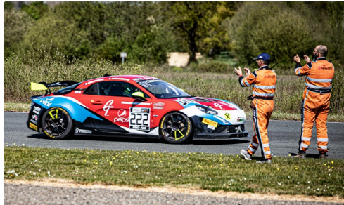
Course 1 Alpine Mirage Racing n°222 Wallgren/Castelli applaudie par des commissaires de piste