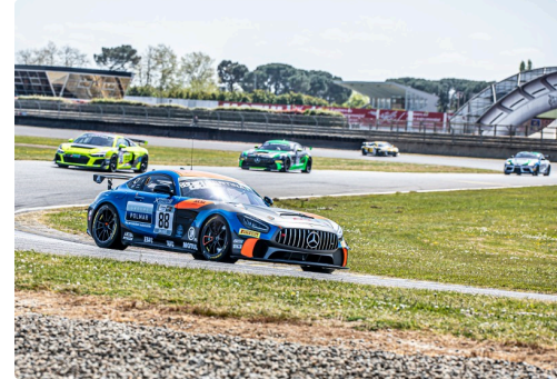
Course2 Mercedes Akka n°88 d'Evrard/Buret