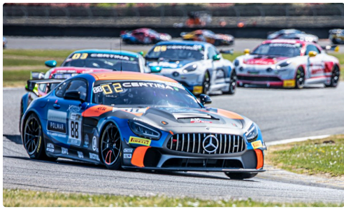
Course 1 Mercedes Akka n°88 d'Evrard/ Buret