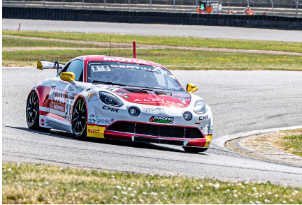
Alpine n°36 Servol/Prost dans la course 1

Ils semblaient donc parier sur une nouvelle victoire des Alpine... Et la course 2 a confirmé ce pronostic : de nouveau Wallgren/Castelli gagnent la course et la 1ère Mercedes-AMG, n°87 (Akka-ASP), celle de Pla/Beaubelique, ne réussit pas mieux que 4e.