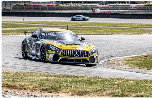
Course 2 Mercedes Akka n°87 Beaubelique/Pla