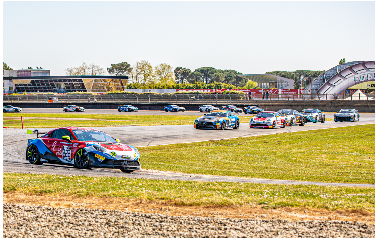
Un Championnat GT4 à Nogaro qui restera dans les annales

Les premières épreuves du Championnat FFSA GT4 ont eu lieu à Nogaro. Elles ont été passionnantes. Refrain : quel dommage qu'il n'y ait pas eu de spectateurs ! Heureusement, les fans ont pu suivre les courses sur Internet.