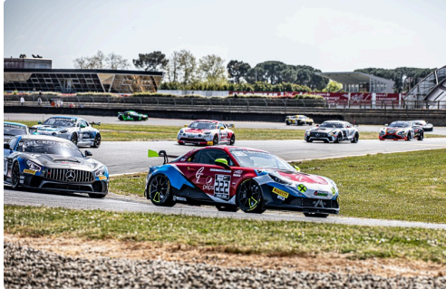
Course 2 Alpine Mirage Racing n°222 de Wallgren/Castelli