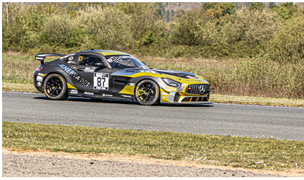
Mercedes n°87 Beaubelique/Pla dans la course 1

Ils semblaient donc parier sur une nouvelle victoire des Alpine... Et la course 2 a confirmé ce pronostic : de nouveau Wallgren/Castelli gagnent la course et la 1ère Mercedes-AMG, n°87 (Akka-ASP), celle de Pla/Beaubelique, ne réussit pas mieux que 4e.