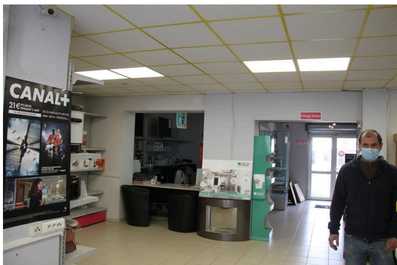
Fabrice Piot présente une autre vue de son magasin, la seconde entrée ou la sortie de secours en quelque sorte.