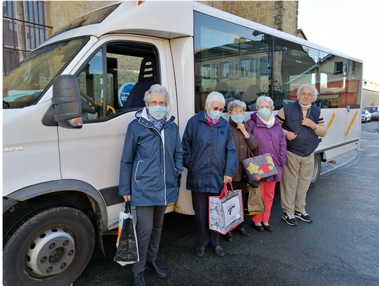
le « Bus Marché » du lundi, une idée gagnante