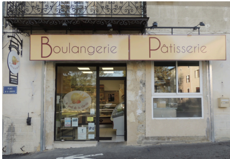
A Gondrin, le pain retrouve son goût, et sa place

Entre deux préparations de mousses au chocolat, il a accepté de répondre à nos questions.