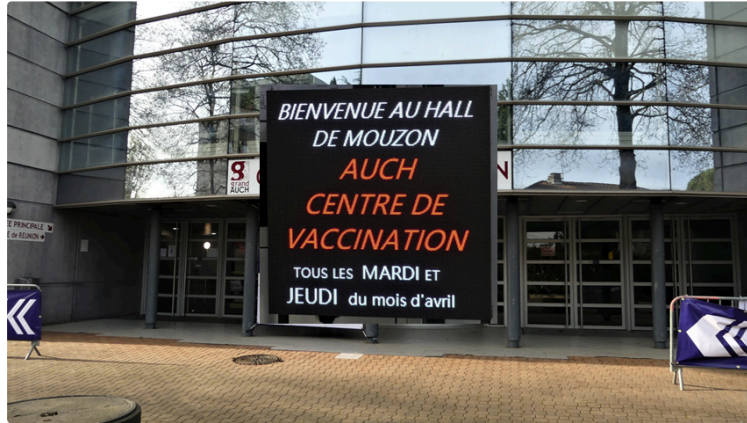
Le Méga vaccinodrome a ouvert : 720 injections