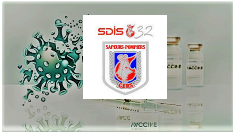
veillée d'armes chez les pompiers gersois

Après l'allocution du président de la République les pompiers gersois sont prêts.