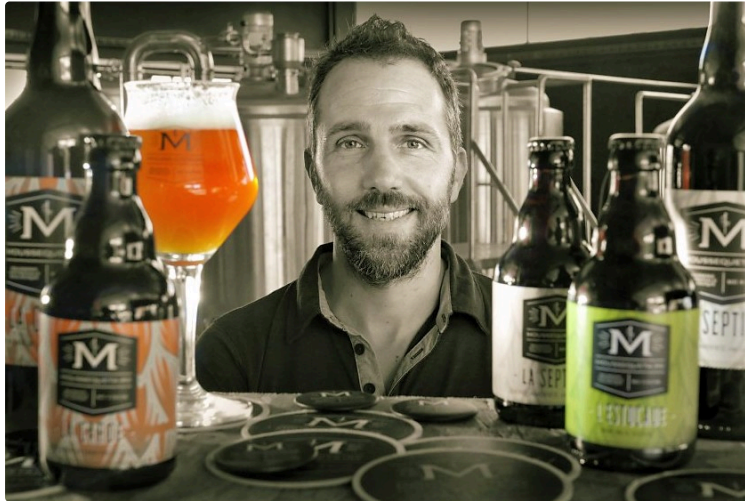
Le Gers a sa MousseQuetaire

La brasserie artisanale qui fleure bon l'histoire de célèbres Gascons