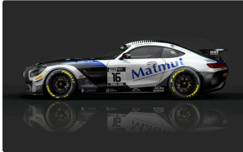
DR 1 Voiture de Thomas Drouet.jpg