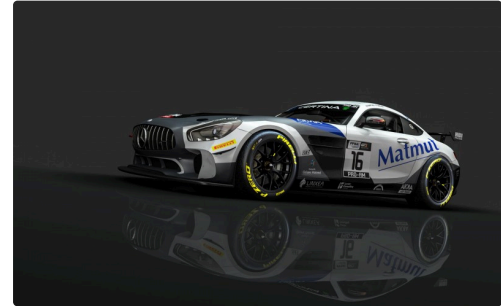
DR 3 Voiture de Thomas Drouet.jpg