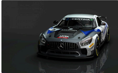
DR 2 Voiture de Thomas Drouet.jpg