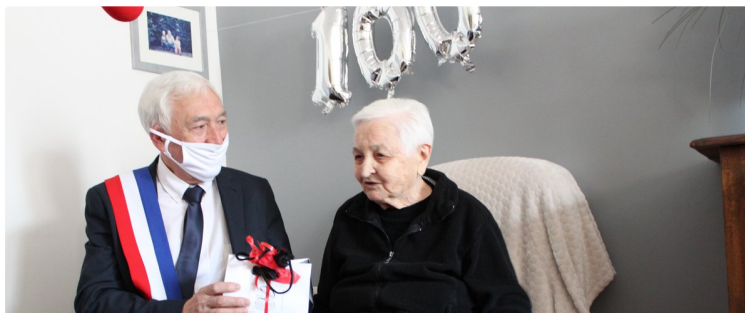
Une centenaire avec un parcours atypique

Découvrez son histoire sur Radio Fil de l'Eau