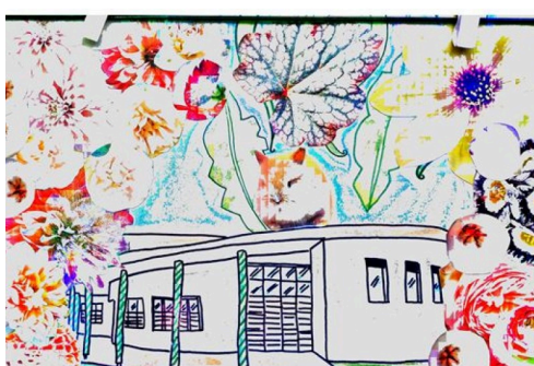
grande lessive marciac 7d.JPG