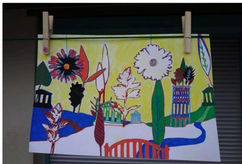
grande lessive marciac 9.JPG