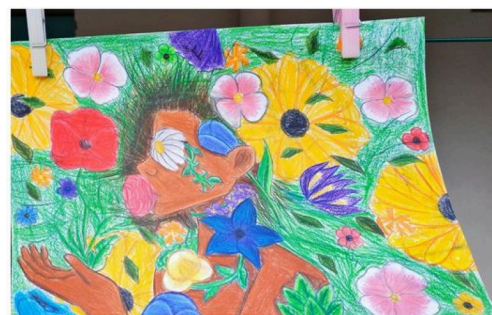
grande lessive marciac 3b.JPG