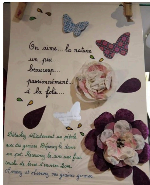
grande lessive marciac 7.JPG