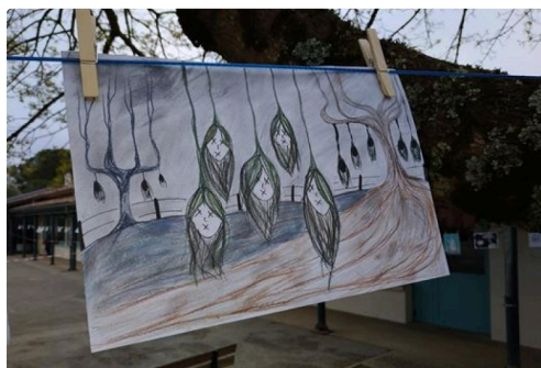
grande lessive marciac 6a.JPG