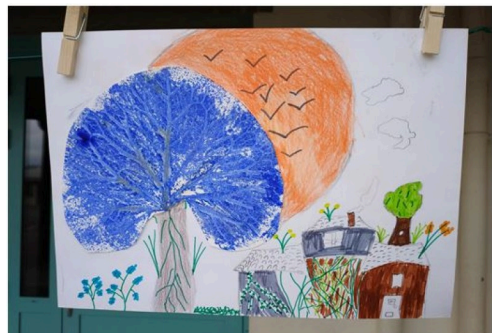
grande lessive marciac 5a.JPG