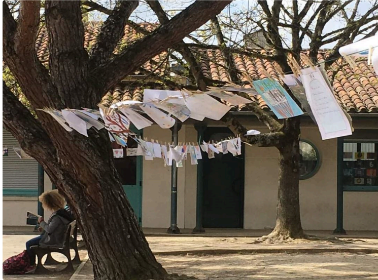
Les écoles ont fait leur " Grande Lessive "

Expressions artistiques des plus diverses