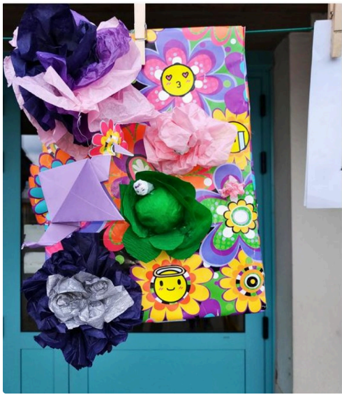
grande lessive marciac 8.JPG