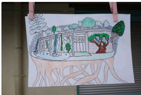
grande lessive marciac 99.JPG