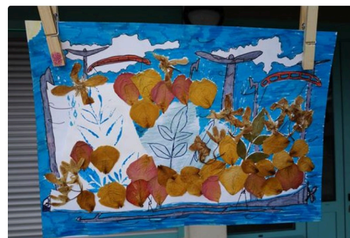
grande lessive marciac 8b.JPG