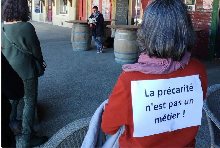
Les amis de l' Astrada et les défenseurs de la culture ne font qu'un, bien qu' ils soient très nombreux

Démonstration tout en douceur ce mercredi matin