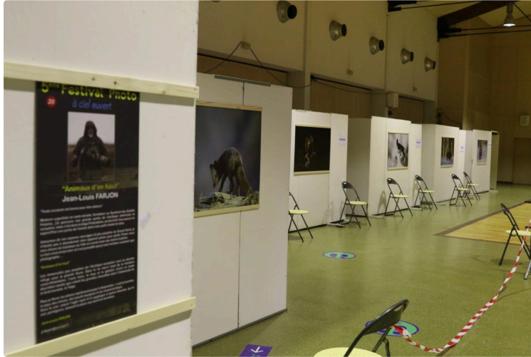
Piqûre d'art !

Ne cherchez pas l'artiste dans la salle, jeudi, il se sera déjà envolé vers la taïga finlandaise !