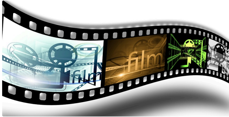
Fête du court métrage 2021 : soirée en ligne vendredi 26 mars

Le Festival du Court Métrage d'Auch continue de faire vivre le court métrage et s'associe avec L'atelier de Pechbonnieu pour organiser une séance de courts-métrages en ligne ce vendredi 26 mars 2021 à 21h.