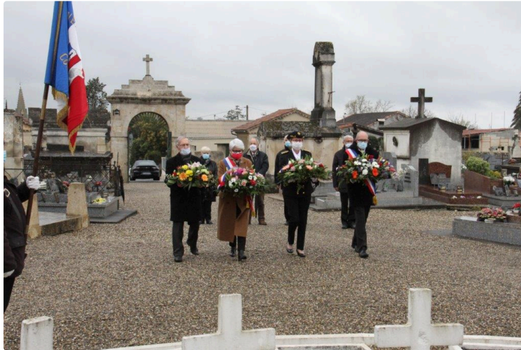
A l'instar de la journée nationale du 19 mars, la France doit travailler à construire une mémoire apaisée

Le message de Geneviève Darrieussecq a été transmis par la sous-préfète de Condom