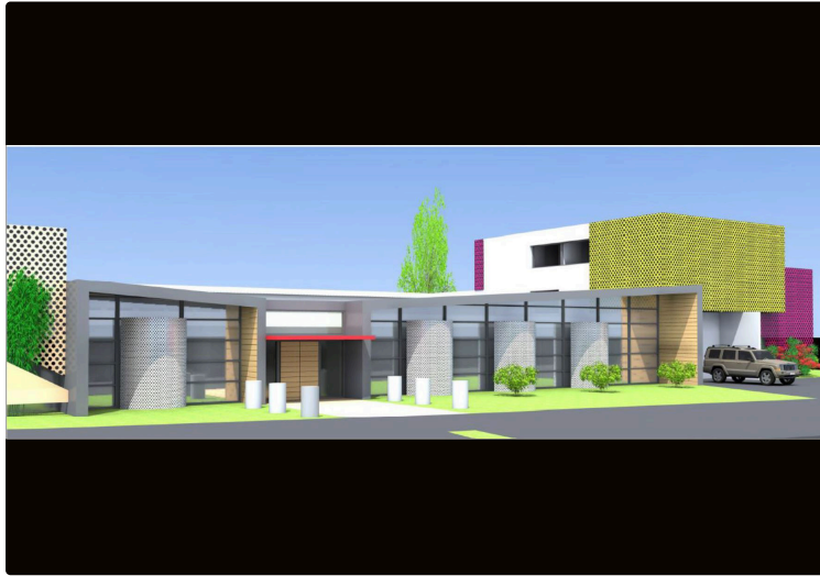
Les filières du vin et de l'armagnac vont avoir leur Maison à Éauze

Pour les services aux professionnels et l'information œnotouristique