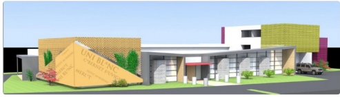
Maquette de l'architecte