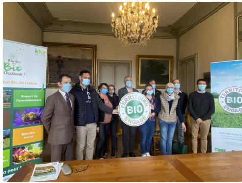
Masqués mais engagés, nos élus, nos représentants et nos agriculteurs