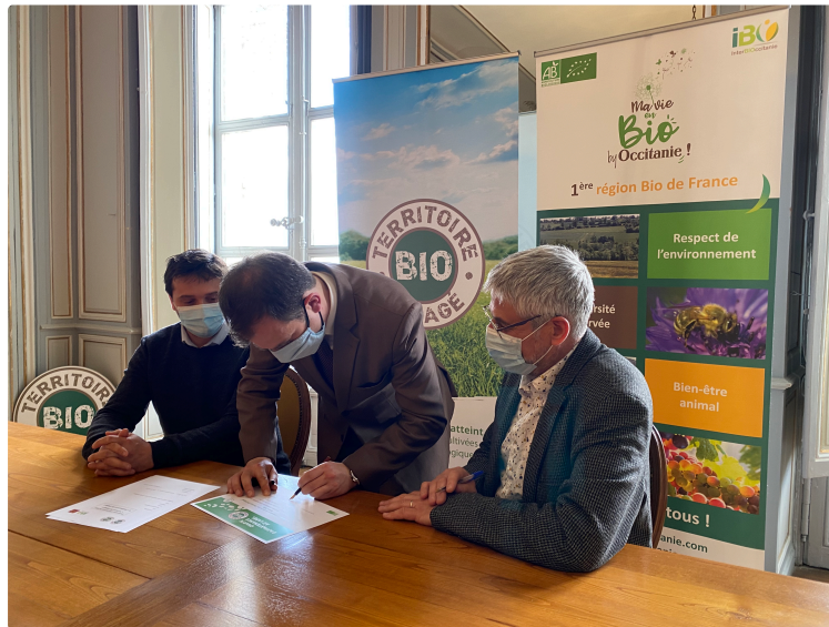
Lecture labellisée et engagée bio!

Le Gers est le département N°1 avec 68.000 hectares de surfaces bio. Il est naturel de voir la belle Lecture suivre le mouvement