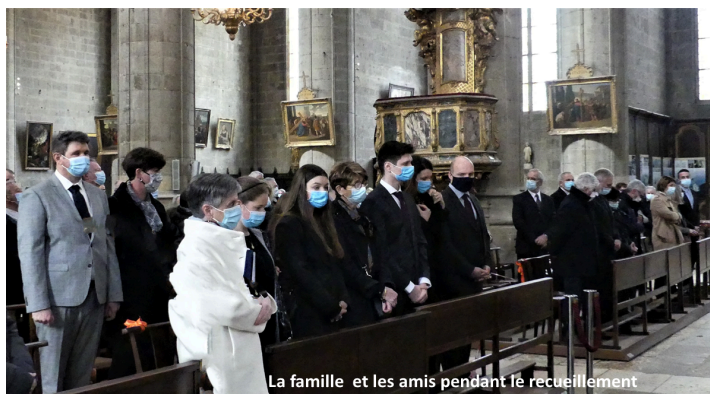
La famille et les amis pendant le recueillement