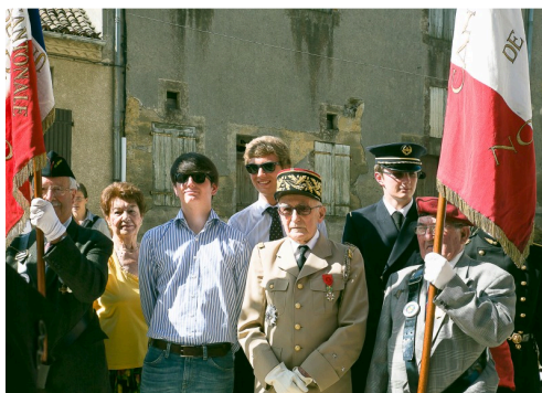
Avec la famille, il vient d'être fait Grand Officier (le 10.08.2012)