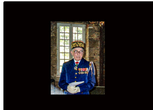
Lors d'une remise de décoration