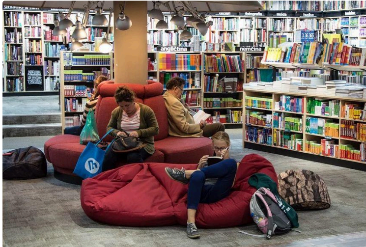
À vos marque-pages !

Alors que le milieu de la culture continue de se battre pour la réouverture des salles de spectacles et des musées, qui se meurent, il aura fallu attendre l'adoption d'un décret officiel, classant les librairies comme « commerces essentiels », pour reconnaître - au bout d'un an de combat - le droit aux populations à accéder aux connaissances.