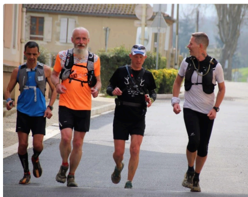
Arrivée à Barran.