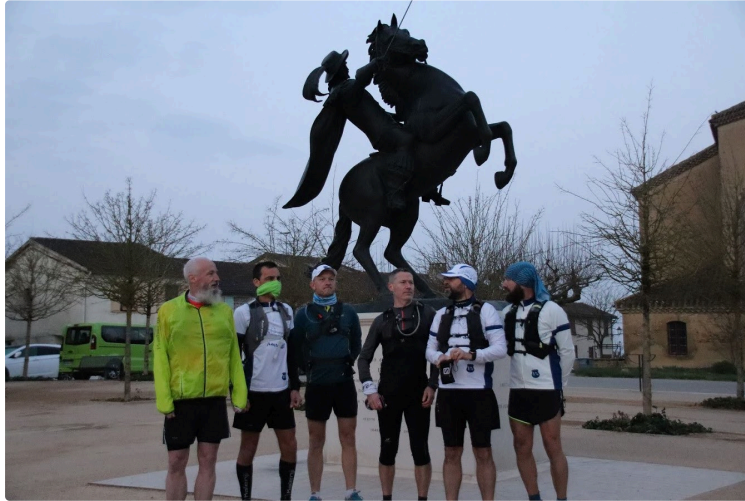
Des runners sur la route d'Artagnan

Un groupe de copains et copines de l'association des 1 % ont utilisé la Route de l'Infante afin de se rendre de Lupiac à Auch soit 62 km