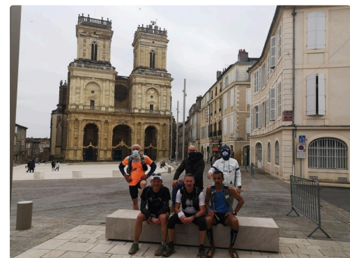
Arrivée à Auch.