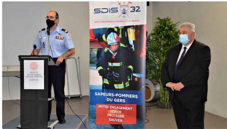
SDIS : les femmes à l'honneur

Depuis bientôt 10 ans, le SDIS du Gers célèbre la Journée Internationale des droits des femmes, d'une manière différente chaque année, mettant à l'honneur l'engagement féminin chez les soldats du feu. Il y a quelques mois, une large campagne de communication était amorcée, avec pour objectif d'atteindre 25% d'effectifs féminins chez les sapeurs-pompiers gersois en 2021.