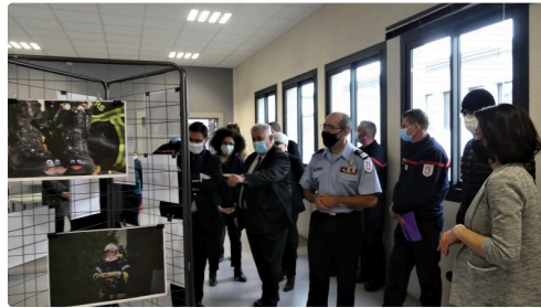
visite de l'exposition photographique