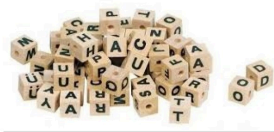
Solution des jeux du week-end

Comment isoler chaque virus en ne traçant que deux carrés ?