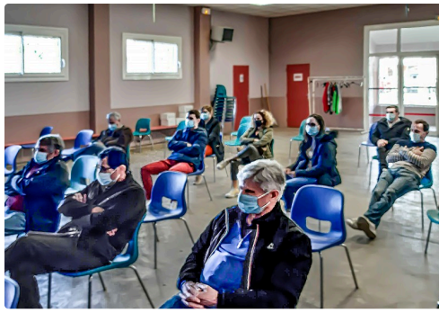
La salle durant la réunion