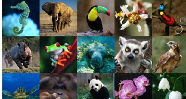
Les oiseaux nicheurs sont une des espèces les plus en danger

A l'occasion de la Journée mondiale de la vie sauvage, découvrez la liste rouge des espèces à surveiller