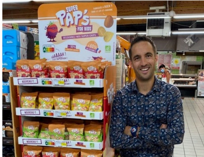
Les chouettes chips de Pap's

Avec 90% de matières grasses en moins que les chips ordinaires, et 60% de légumes bio goûteux, l'apéritif a une autre allure