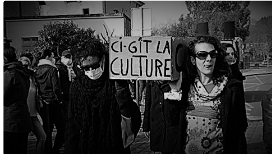
Ci-gît la culture ,

4 mars 2021 – Appel unitaire des organisations du spectacle – Culture en danger : le temps des engagements !