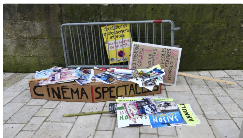
la culture est morte !