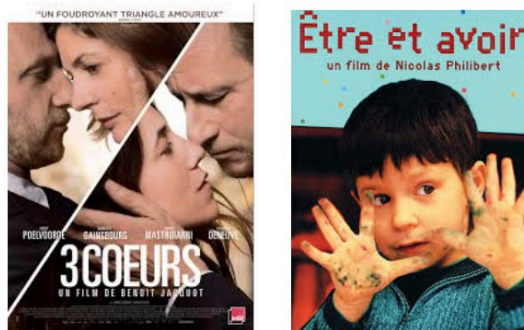
A la télévision vendredi soir...

Une soirée policiers, un film-documentaire, un drame et le concert des Enfoirés à vous suggérer pour votre soirée de vendredi.