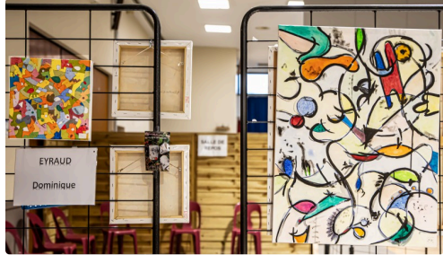
Tableaux de Dominique Eyraud