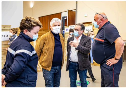
Discussion avec des sapeurs-pompiers