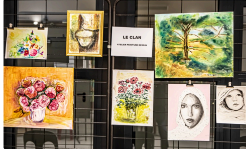
Atelier peinture et dessin du Clan