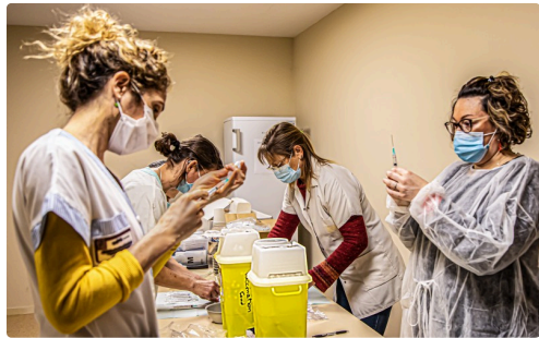
Les infirmières préparent les seringues le matin à 8 heures et l'après-midi à 13 heures