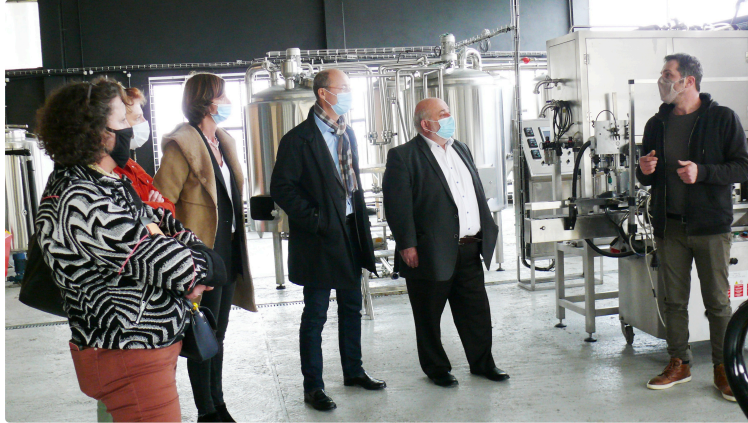
Le président de la Chambre des métiers du Gers prend le pouls de trois entreprises