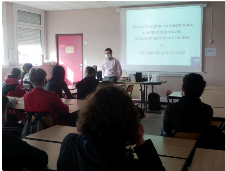
Les jeunes du collège Hubert Reeves confrontés aux théories du complot et aux fake news

Des intervenants du Mémorial de la Shoah de Paris sont venus auprès des jeunes de 3e pour les faire réfléchir aux théories du complot, aux informations et désinformations et à la fabrication de l'image via les affiches de propagande.