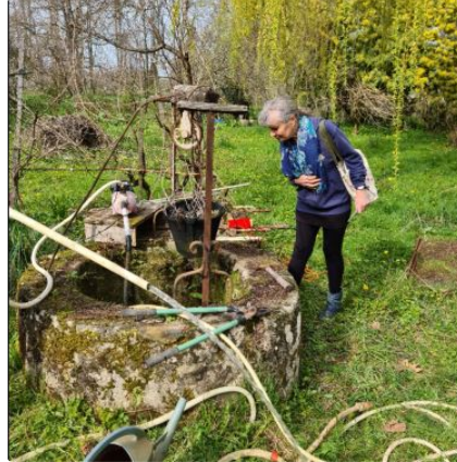
Un jardin partagé et plus encore

Une belle initiative de l'association AEDS