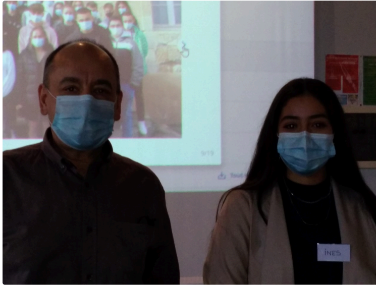
EJERIE : Entreprise de jeunes lycéens...