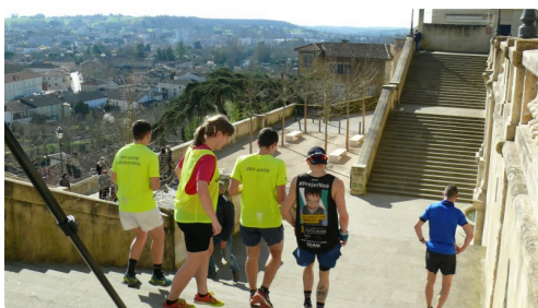
C'est reparti pour une descente.