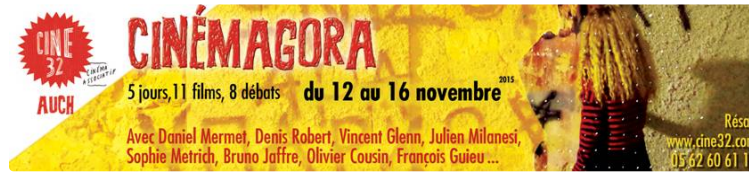
AUCH CinémAgora s'étoffe avec cinq jours d'ouverture

Onze films documentaires et autant de débats sont au programme