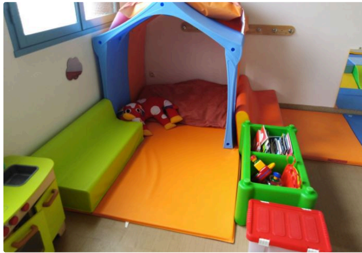
De nouveaux horaires d'ouverture

Le Lieu d'Accueil Enfants Parents (LAEP) de Fleurance, La P'tite PARENThèse, modifie ses jours d'ouverture : l'occasion de rappeler ses objectifs au sein du pôle petite enfance de la Ville.