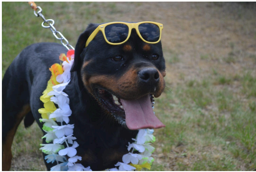
Odin version Hawaï !