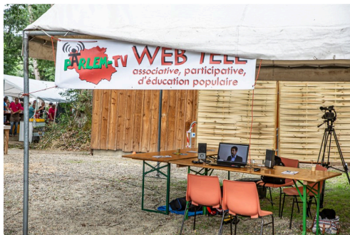
Stand de Parlem TV à l'Ecofête de Perchède en 2019