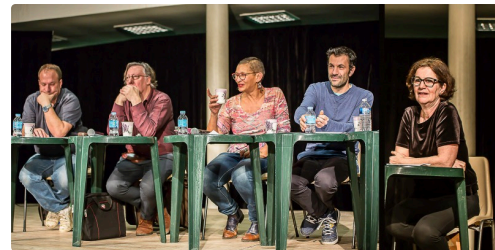
Enregistrement de l'émission " Quelle école" en 2018