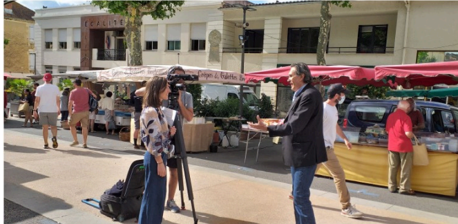
Le Gers à l'honneur sur Arte, c'est aujourd'hui !

Pour rappel, l'émission "Invitation au voyage" diffusée quotidiennement sur Arte à 16 h 30 fait aujourd'hui la part belle au Gers comme nous vous en parlions lundi dernier.