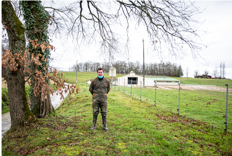
Grippe aviaire : la parole aux pros de l'élevage

Nous commençons la publication de comptes rendus d'entretiens avec des producteurs de palmipèdes que nous avons rencontrés. La question de l'avenir des exploitations se pose avec force. Nous donnons la parole à ceux qui en vivent.