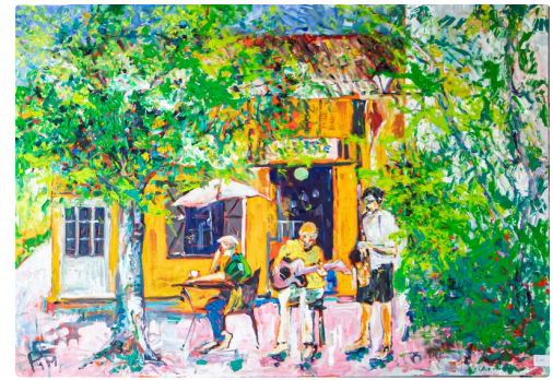
Tableau de Pim Harren