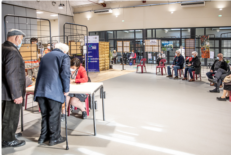
Vaccin et expo simultanés à Nogaro

Un peintre et un photographe exposent pendant la vaccination