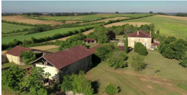
Pleins feux sur Vic-Fezensac et le Gers sur la chaîne Arte !

Lupiac parmi les vingt destinations pour « rêver d'ailleurs sans quitter son pays » sélectionnées par Le Monde, un reportage sur Vic-Fezensac au 13 h de France 2, la ferme du Hitton sélectionnée pour représenter l'Occitanie dans le cadre de l'émission de France 3 « La ferme préférée des Français » et vendredi prochain, Vic-Fezensac sur Arte !