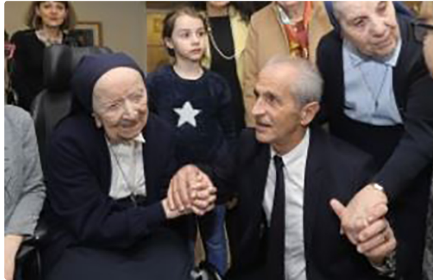
La doyenne de France et d'Europe fête aujourd'hui ses 117 ans